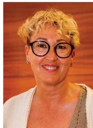
Consellera (Des de setembre de 2020)

Marta Farrés Falgueras Alcaldeessa de Sabadell