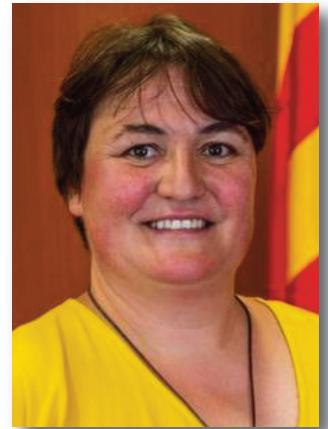
Consellera (Des d'octubre de 2022)