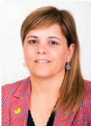
Consellera (Des de març de 2024)

Quatre persones en representació dels municipis als quals FGC presta serveis