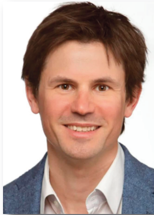
Conseller (Des d'octubre de 2022)

Quatre persones en representació del departament de l'Administració de la Generalitat competent en matèria d'infraestructures i mobilitat, amb rang mínim de director general